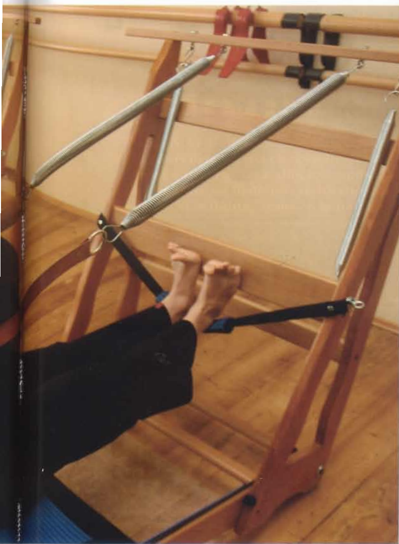
Gli attrezzi Un modo nuovo di concepire la palestra: alcuni momenti di Girotonica